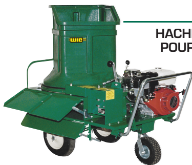
HACHE-PAILLE POUR LITIÈRE