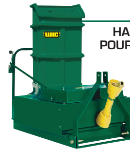
HACHE-PAILLE POUR FRAISIÈRE